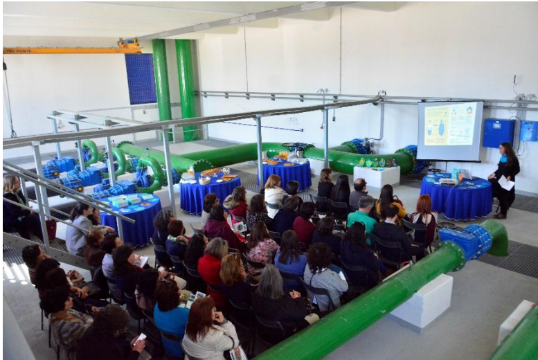
ETA da Mata do Urso